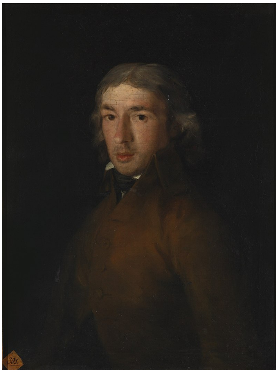
Leandro Fernández de Moratín retratado por Goya en 1799